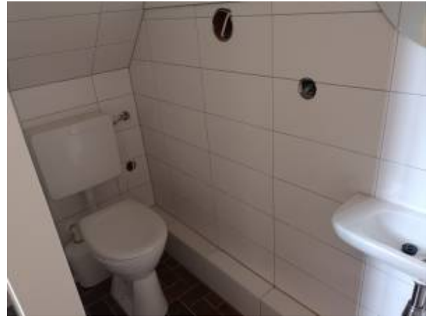
29. März: Die Fliesen sind an der Wand.