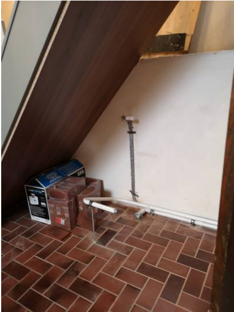
Mitte Februar: WC im Rohbau.