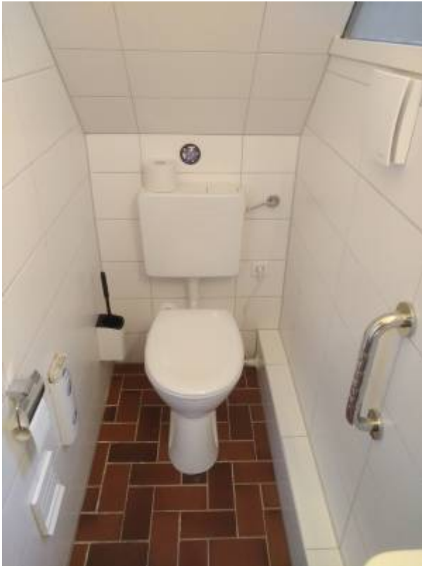
27. April: Nun sind schon ein Stützgriff und die Halterung für Papier angebracht