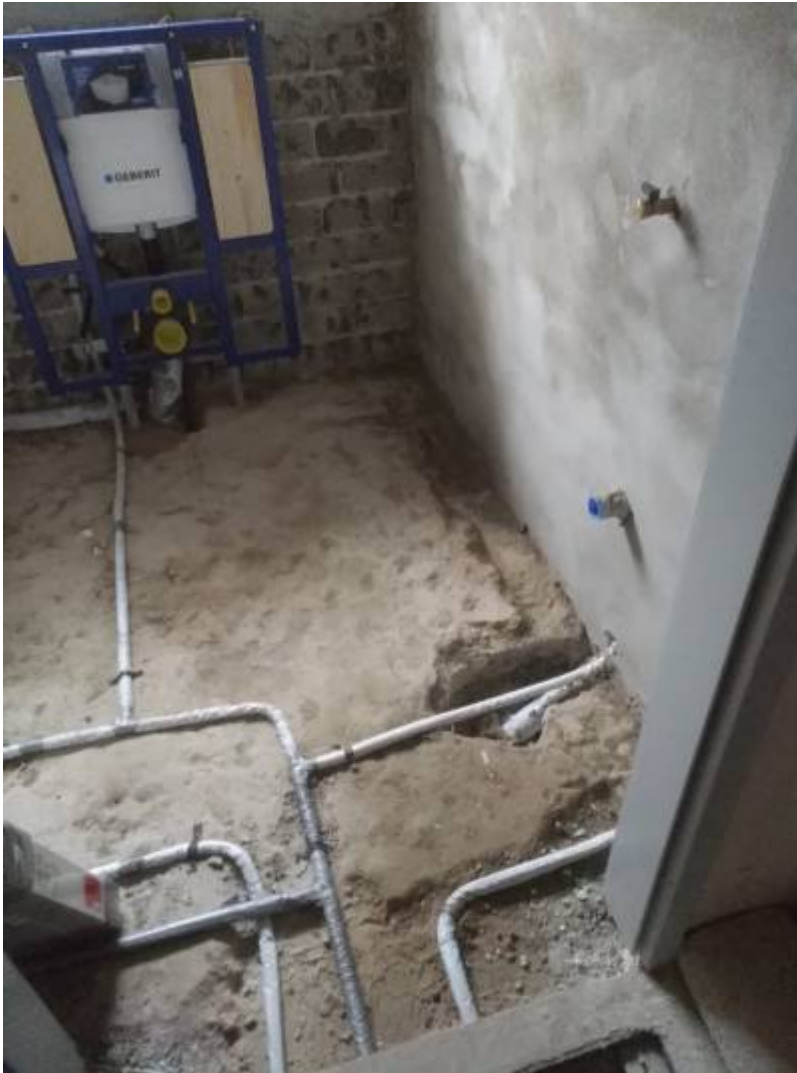
2. November 2022: Hier sieht man einen Sanblock - unverkleidet.