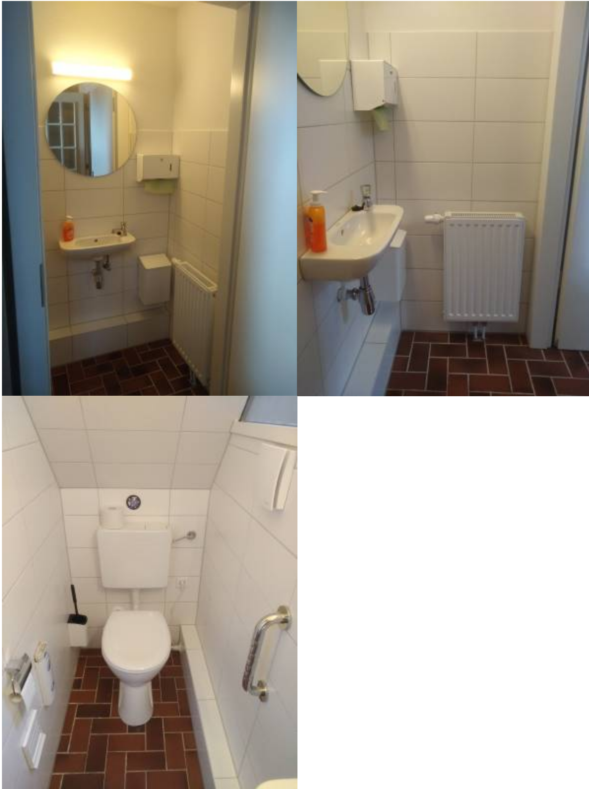
27. April: Nun sind schon ein Stützgriff und die Halterung für Papier angebracht